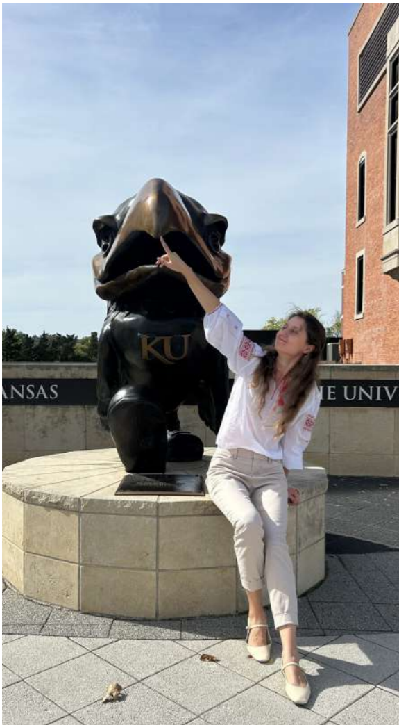
З Jayhawk, талісманом Університету Канзасу

Академічний рік 2024-2025 я розпочала в Університеті Канзасу, де асистую у викладанні