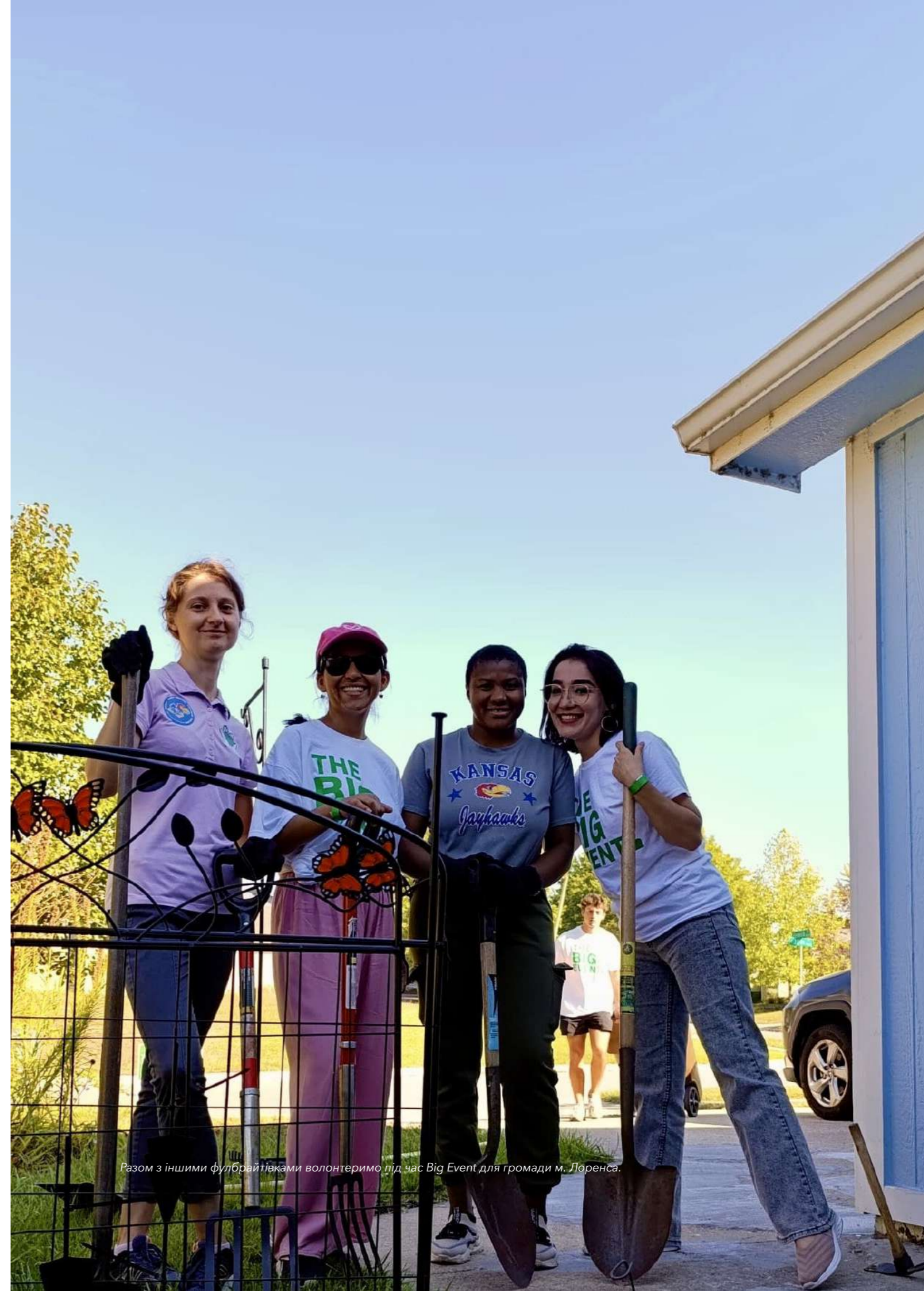
Разом з іншими фулбрайтівками волонтеримо під час Big Event для громади м. Лоренса.

Я переконана, що освіта – це інструмент, який формує не лише особистість, але й визначає майбутнє суспільства. Вдячна колегам з Університету Канзасу та Програмі Фулбрайта за можливість не тільки професійного розвитку, але й за внесок у підвищення обізнаності світу про Україну. Цей досвід надихає мене і мотивує до нових досягнень.